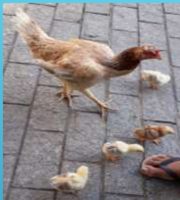
GALINHA E PINTINHOS