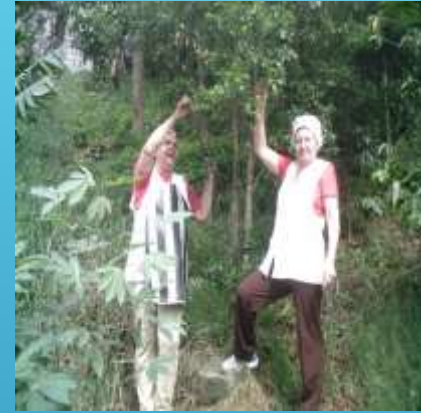
CEREJA E MANDIOCA