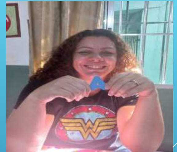
ORIENTADOR SÓCIOEDUCATIVO 4HS