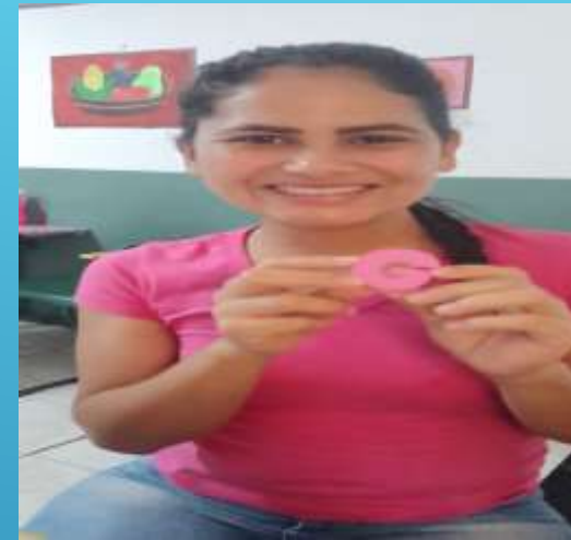
ORIENTADOR SÓCIOEDUCATIVO 8 HS