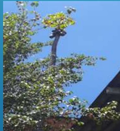
ABACATE E PITANGA