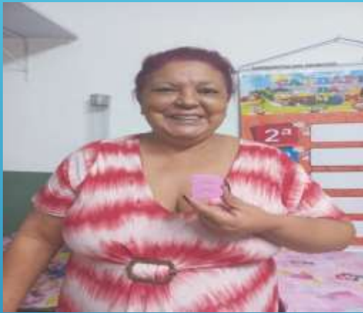
GERENTE DE SERVIÇOS